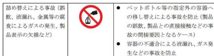
図 「家庭用消費者製品における製品安全表示図記号の使用・適用等に関する自主基準 附属書2 予見される事故に関連する安全図記号及びその防止効果」日本石鹼洗剤工業会 制定年月日：平成28年12月16日