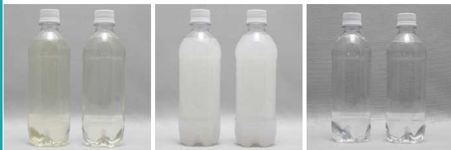
清涼飲料水 洗濯用合成洗剤 清涼飲料水 洗濯用合成洗剤 清涼飲料水 消毒液