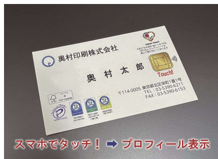
スマホでタッチ! → プロフィール表示

オフセット印刷から最先端のデジタル印刷まで、高度な技術を駆使し企画・制作から印刷・加 工までをワンストップで一貫生産する「奥村品質」は、ISO 9001(品質マネジメントシステ ム)認証により裏付けられています。紙とデジタル技術を融合させたクロスメディア・ソリュー ションにより生まれた「Smart Meishi」は、ICチップを内蔵した紙名刺で、独自のDXソリュー ションを通じてお客様の業務に貢献します。サステナビリティ(持続可能性)への取り組みは、 防災備蓄品として開発した折り紙食器「beak」が、IPA 2024 Global「サステナビリティ」部 門で第1位を獲得するなど国際的に評価されており、その応用形である箱型食器「beakx」は、 「JAPAN PACK AWARDS カテゴリー最優秀賞」を受賞しました。