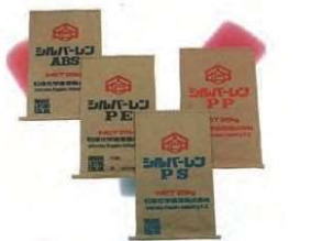
シルバーレーン樹脂（自社ブランド）