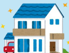
床面積の合計100㎡準耐火建築物