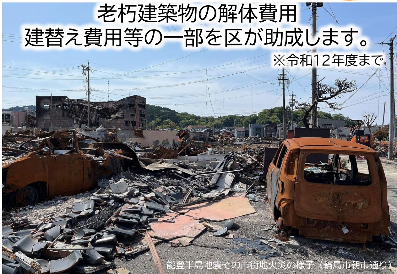
能登半島地震での市街地火災の様子（輪島市朝市通り）

東京都には木造住宅密集地域(木密地域)が広範囲で分布しており、木密地域は首都直下地震が発生した場合に、地域火災などの大きな被害が想定されています。