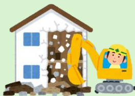
耐用年数の2/3を経過した老朽建築物