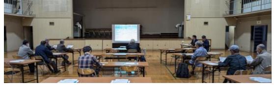
第30回 十条北ブロック部会の様子