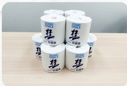
再資源化を常に検討！