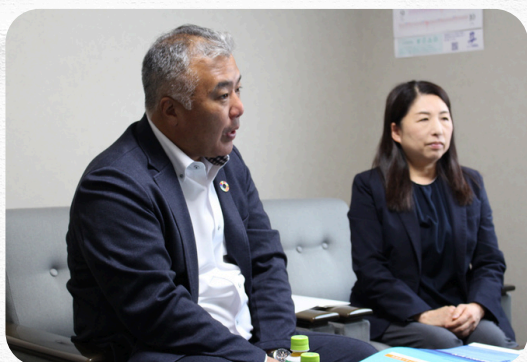
「回収すれば全て資源」 の理念を掲げる。