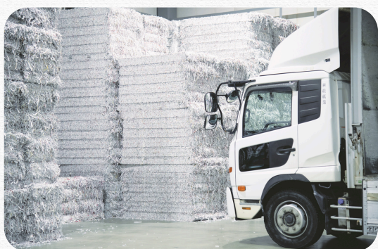
地域の古紙を回収・運搬