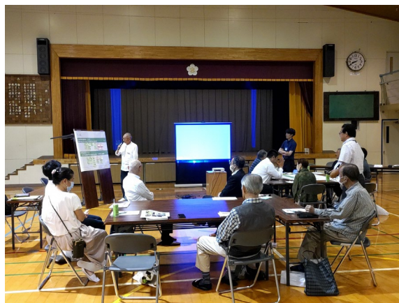
第10回定例会の様子