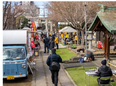
昨年度の防災イベント「いわぶちまち防災オープンデー！」の様子