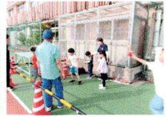
火曜 けんだま体験