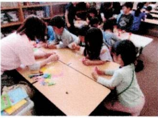
月曜 おりがみ体験