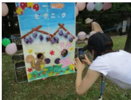
ぶどう狩り顔はめパネルの フォトスポット