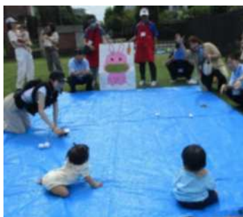
お月見 ハイハイレース