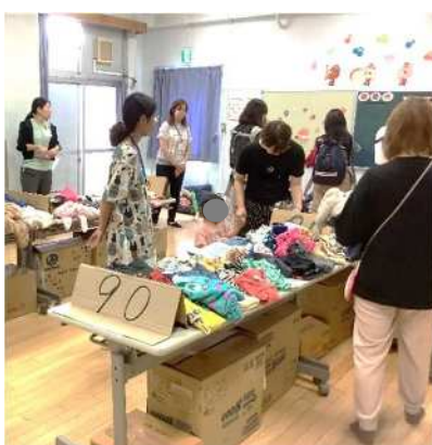
↑ 赤羽西児童館 24日（水）