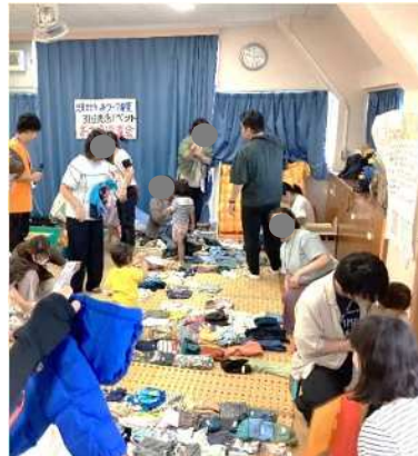
↑ 西が丘児童館 20日（土）