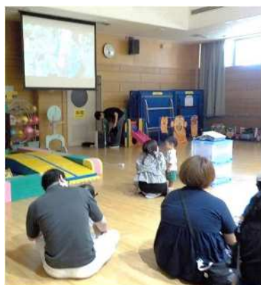
↑ 桐ヶ丘児童館 17日（水）

今回は私たちの活動風景を動画にまとめて伝えた後、おさがり交換を通して参加者同士の交流を図りました。おさがり品は児童館利用者だけでなく、近隣保育園や地域の掲示板を見て知った地域住民の方からもたくさんいただきました。また、2月には3館合同でおさがり交流会の開催があります。おさがり交換の他にも、こども達の遊べる場所やふれあいタイムなど、企画を通して、交流ができたと思っています。