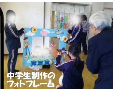
中学生制作の フォトフレーム

中学生も準備から当日まで大活躍！家族での参加が多く、フィナーレでは中学生を中心にみんなで一緒にダンスを踊り、大盛り上がり！幼児・保護者・中学生・地域と年齢を超えた交流が深まりました♪