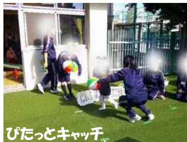
ぴたっとキャッチ