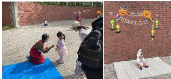
トリックオアトリート!