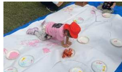
お月見フィンガー ペインティング!