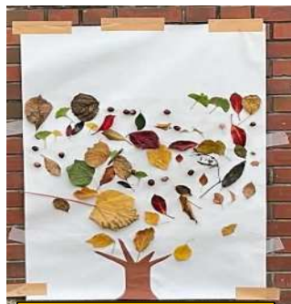
秋の自然いっぱい ネイチャーアート