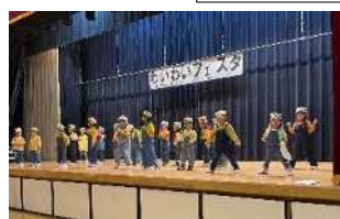
ハ幡山子どもセンターダンスクラブ