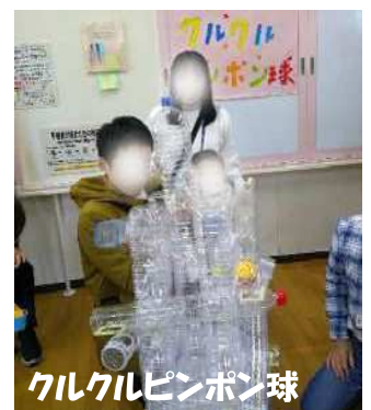
クルクルピンポン球