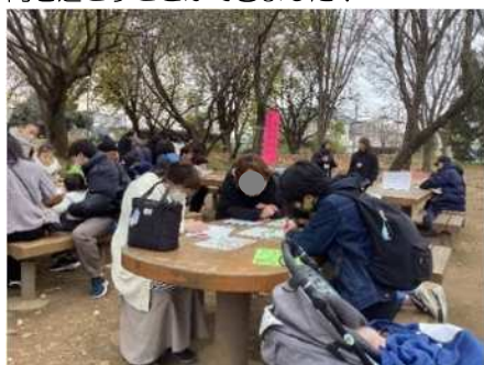
↑ パーソナルカードづくり

防災を身近に考えられる機会となるように、スタンプラリー形式でコーナーを設け、多くの方に体験してもらい、実りのある時間を過ごすことができました！