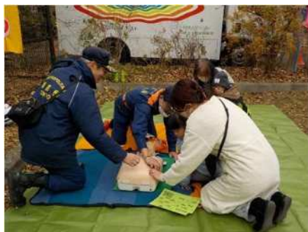
↑ AED 体験