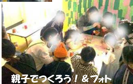
親子でつくろう！&フォト