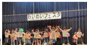
十条台子どもセンターダンスクラブ