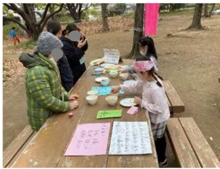
↑ ピカッと反射プレスレットづくり