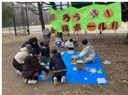
↑ 座ろうぜ！段ボール！！