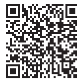
預かり保育における 無償化部分