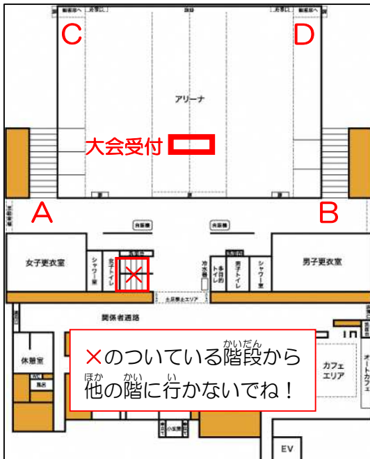
【体育館 1 階】